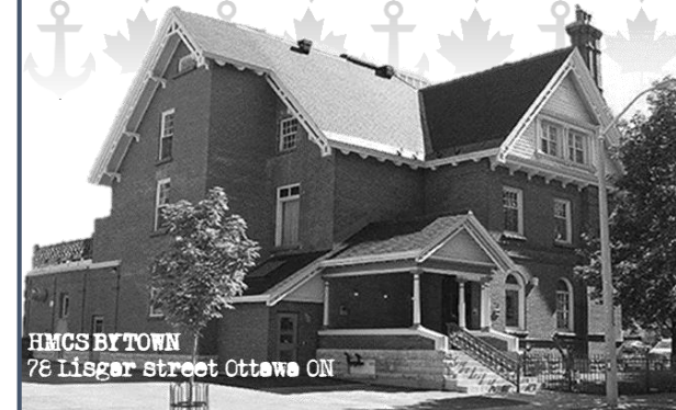
HMCS BYTOWN 78 Lisgar Street Ottawa ON