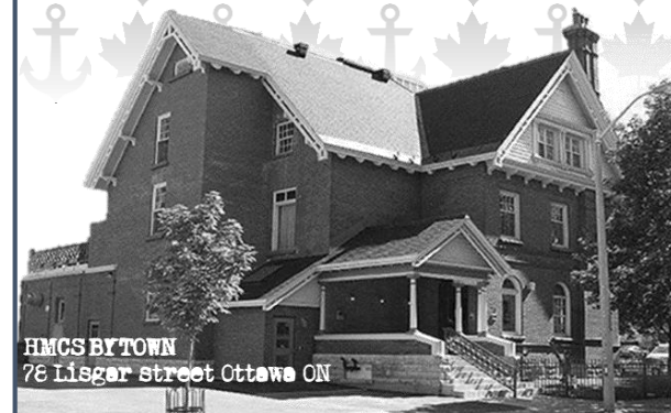
HMCS BYTOWN 78 Lisgar Street Ottawa ON